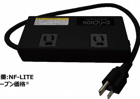
型番:NF-LITE オープン価格*

外形寸法: W175×D85×H32(mm)※突起部除く 質量: 約400g PSE取得済 日本製